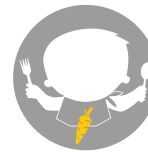
Après le sevrage